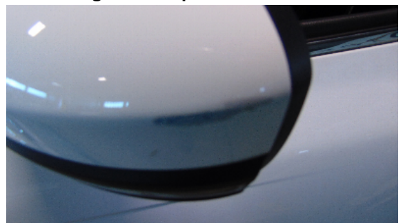
Abbildung 10: siehe pos.10