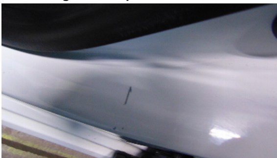
Abbildung 9: siehe pos.9