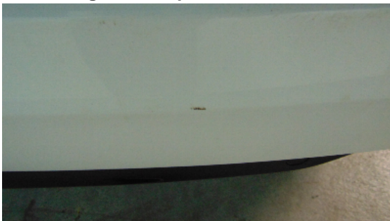
Abbildung 7: siehe pos.7