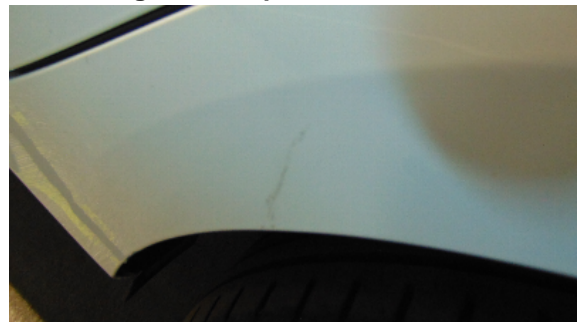
Abbildung 8: siehe pos.8