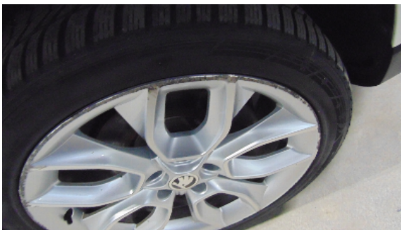
Abbildung 1: siehe pos.1