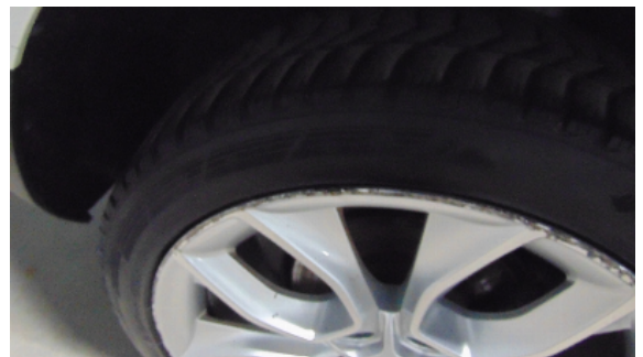
Abbildung 2: siehe pos.2