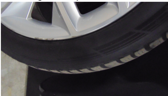
Abbildung 3: siehe pos.3