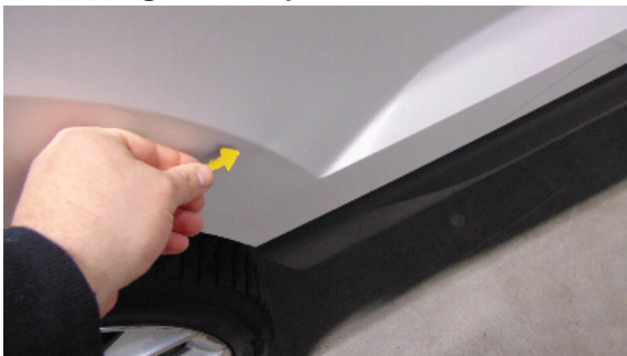
Abbildung 7: siehe pos.7