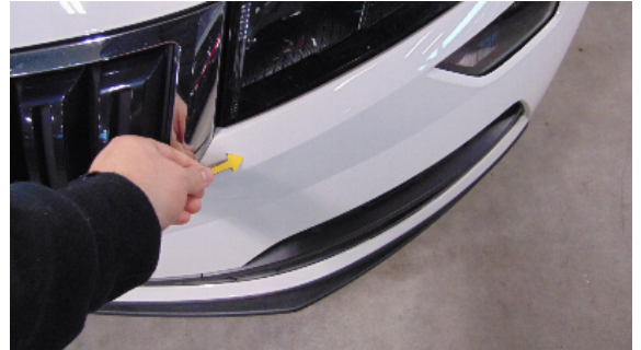
Abbildung 6: siehe pos.6