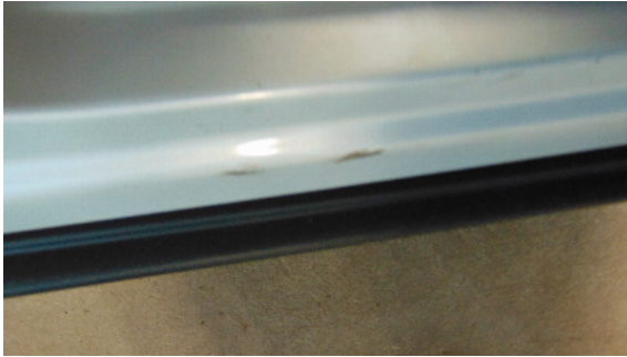
Abbildung 3: siehe pos.3