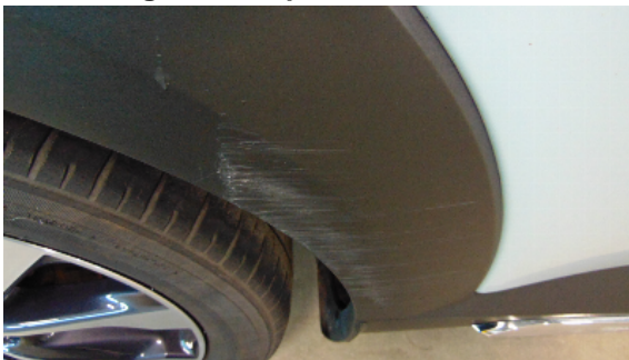
Abbildung 5: siehe pos.4.1