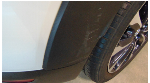
Abbildung 6: siehe pos.5