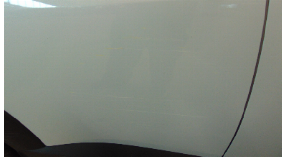
Abbildung 4: siehe pos.4