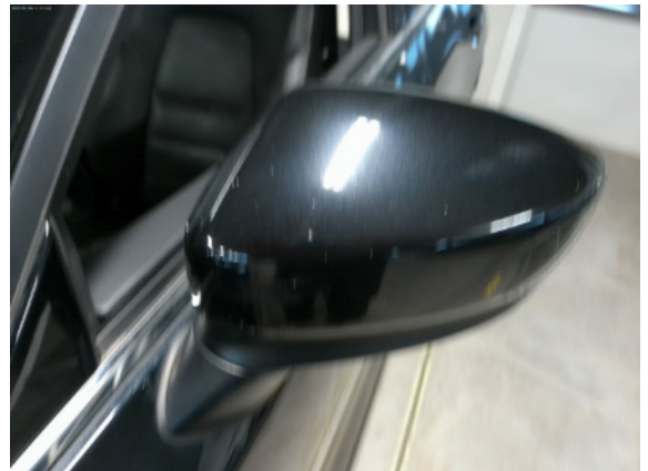
Abbildung 6: Siehe Pos.5