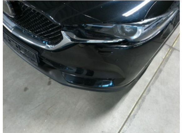
Abbildung 4: Siehe Pos.3