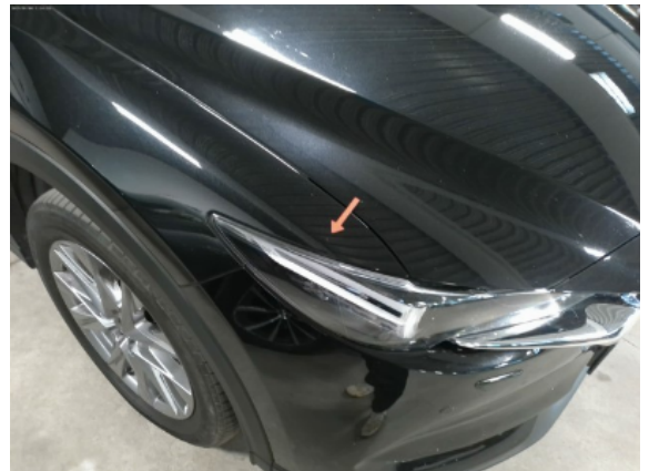
Abbildung 12: Siehe Pos.11