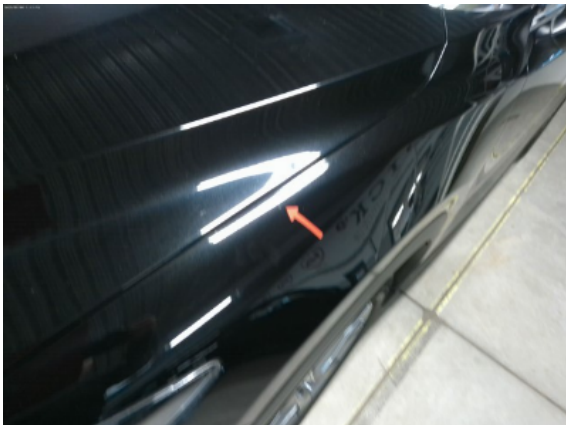
Abbildung 5: Siehe Pos.4