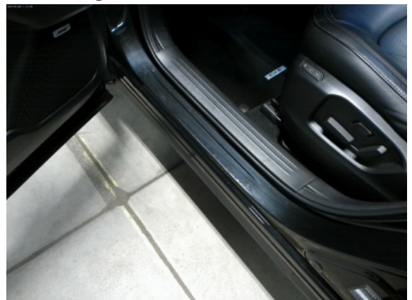
Abbildung 8: Siehe Pos.7