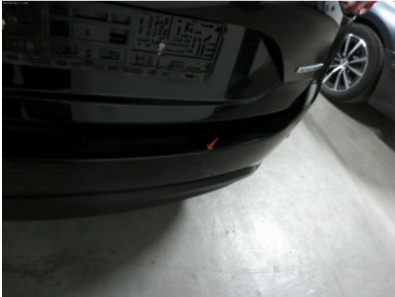
Abbildung 9: Siehe Pos.8