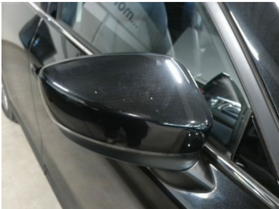
Abbildung 11: Siehe Pos.10