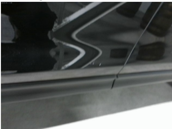
Abbildung 7: Siehe Pos.6