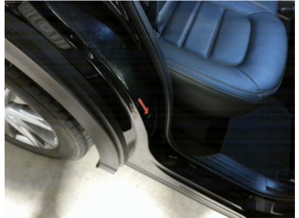
Abbildung 10: Siehe Pos.9