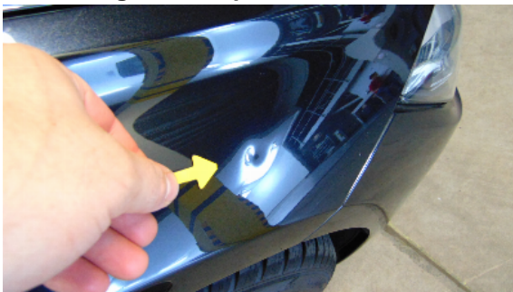
Abbildung 5: siehe pos.5