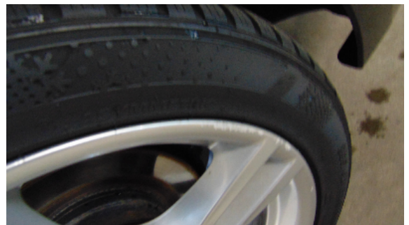
Abbildung 2: siehe pos.2