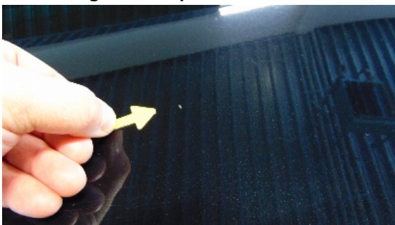
Abbildung 7: siehe pos.7