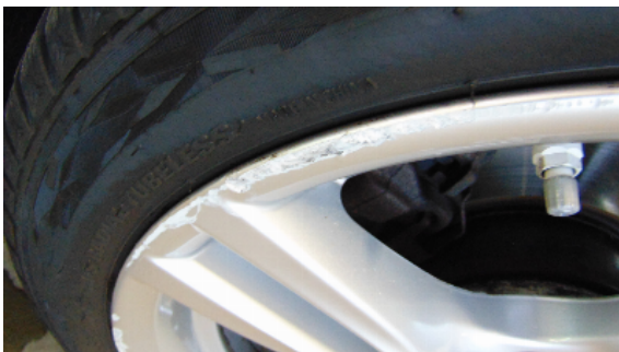
Abbildung 1: siehe pos.1