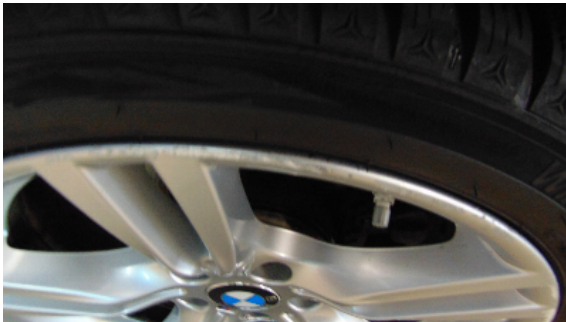
Abbildung 3: siehe pos.3