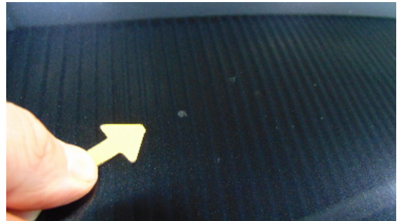
Abbildung 4: siehe pos.4