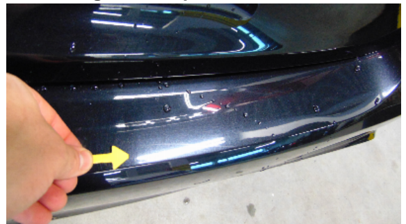
Abbildung 6: siehe pos.6