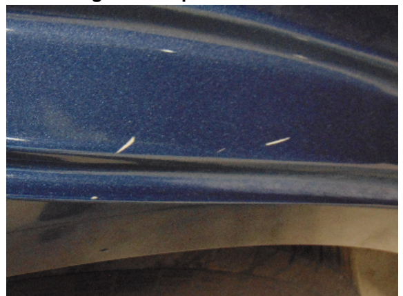
Abbildung 4: siehe pos.4