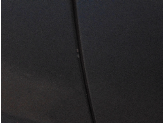
Abbildung 5: siehe pos.5