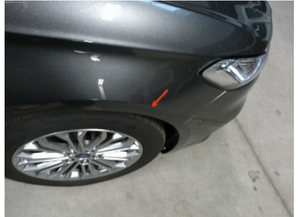
Abbildung 10: Siehe Pos.10