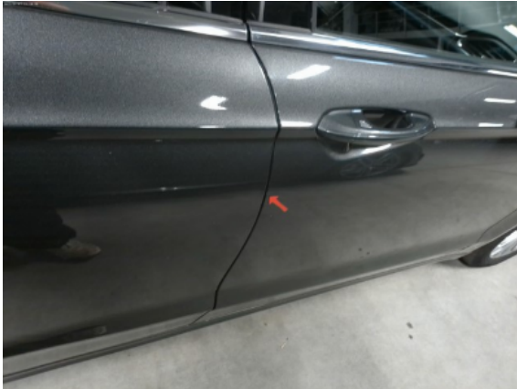
Abbildung 9: Siehe Pos.9