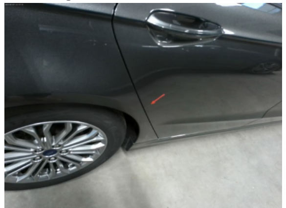
Abbildung 8: Siehe Pos.8