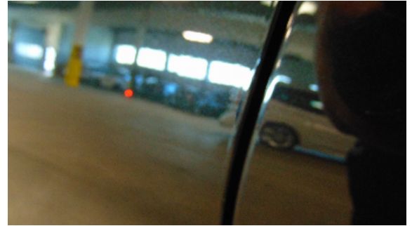
Abbildung 6: siehe pos.6