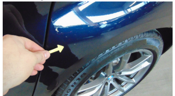
Abbildung 8: siehe pos.8