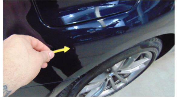
Abbildung 6: siehe pos.6