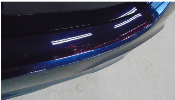
Abbildung 7: siehe pos.7