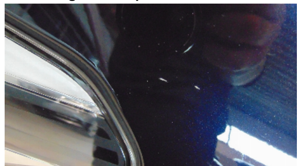
Abbildung 10: siehe pos.10