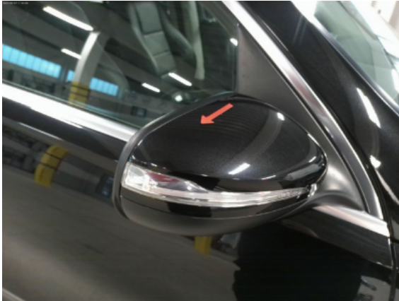
Abbildung 9: Siehe Pos.9