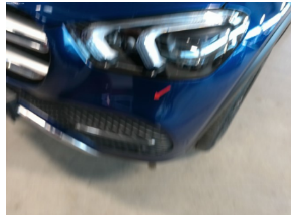
Abbildung 4: Siehe Pos.3