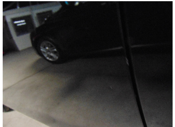
Abbildung 6: siehe pos.6