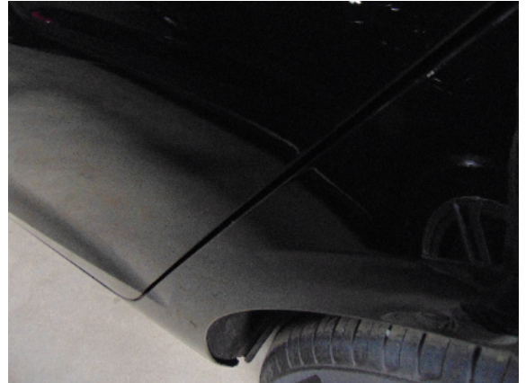
Abbildung 4: siehe pos.4