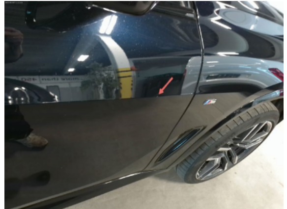
Abbildung 12: Siehe Pos.11