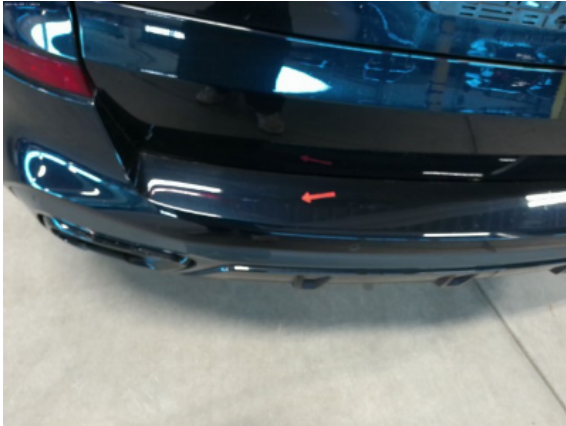
Abbildung 9: Siehe Pos.8