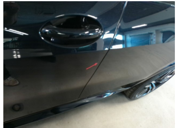
Abbildung 6: Siehe Pos.5