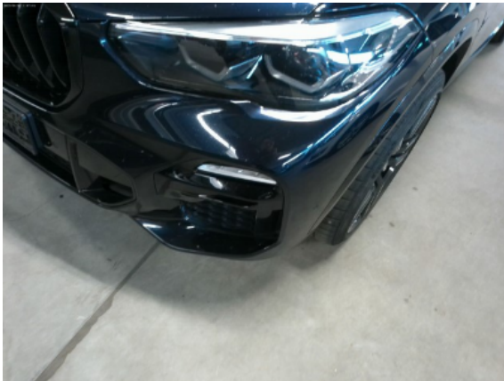
Abbildung 3: Siehe Pos.2