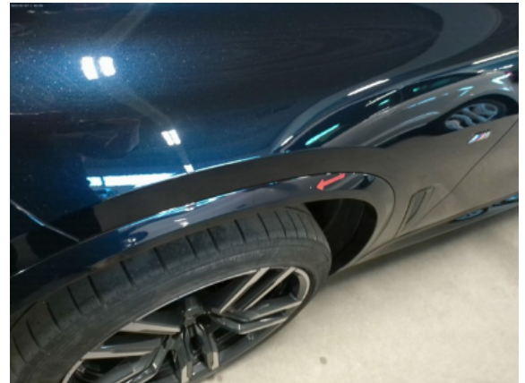
Abbildung 4: Siehe Pos.3