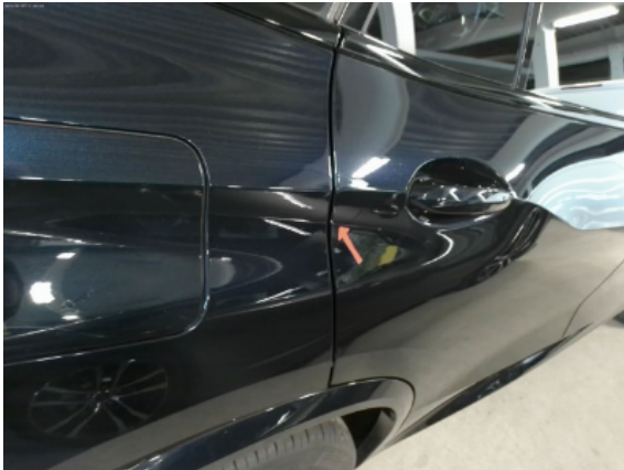
Abbildung 11: Siehe Pos.10