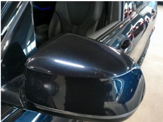
Abbildung 5: Siehe Pos.4