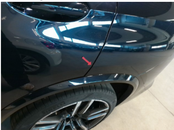
Abbildung 7: Siehe Pos.6