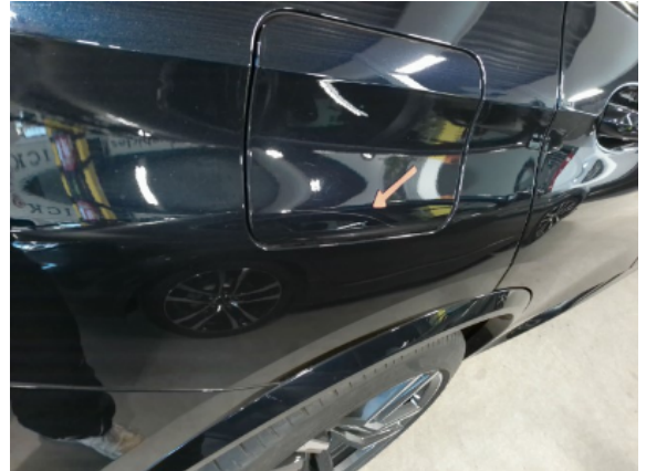
Abbildung 10: Siehe Pos.9