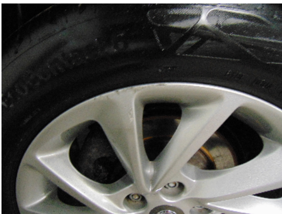
Abbildung 1: siehe pos.1