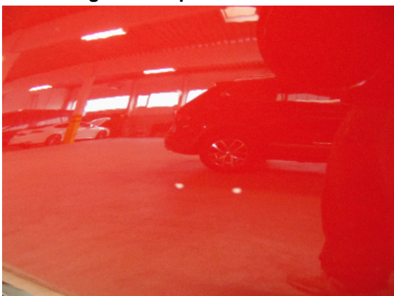
Abbildung 7: siehe pos.7