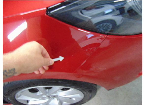
Abbildung 4: siehe pos.4