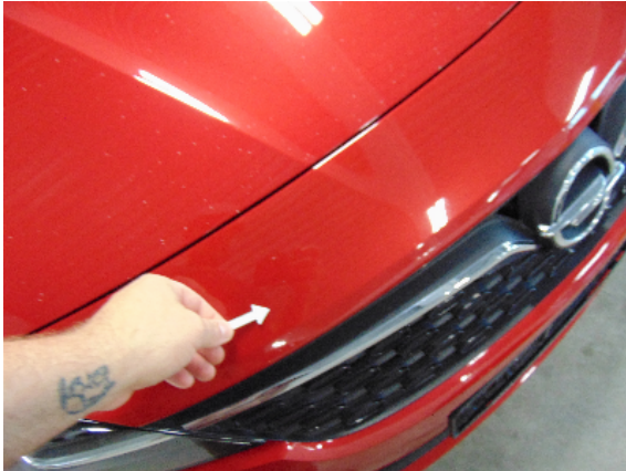
Abbildung 3: siehe pos.3