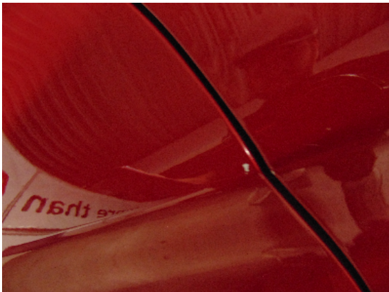
Abbildung 5: siehe pos.5