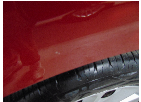
Abbildung 6: siehe pos.6