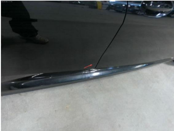
Abbildung 11: Siehe Pos.10