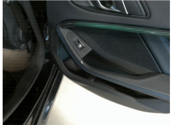
Abbildung 10: Siehe Pos.9