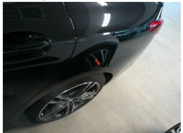
Abbildung 8: Siehe Pos.7