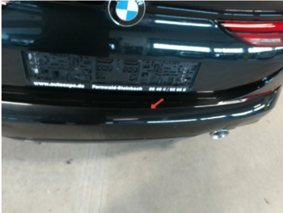
Abbildung 9: Siehe Pos.8