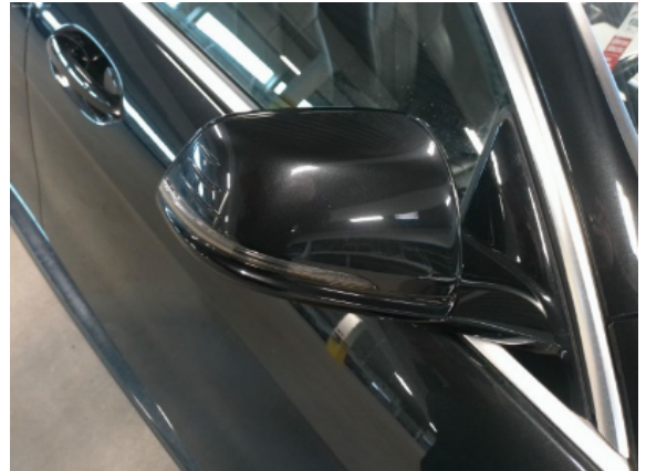
Abbildung 12: Siehe Pos.11