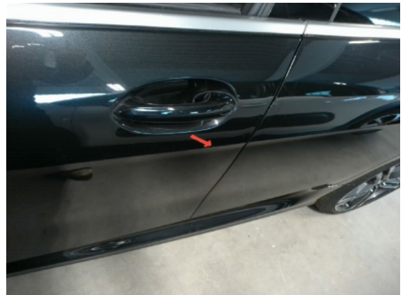
Abbildung 6: Siehe Pos.5