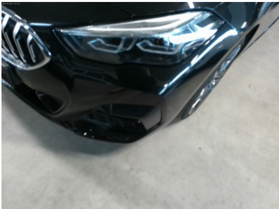
Abbildung 5: Siehe Pos.4