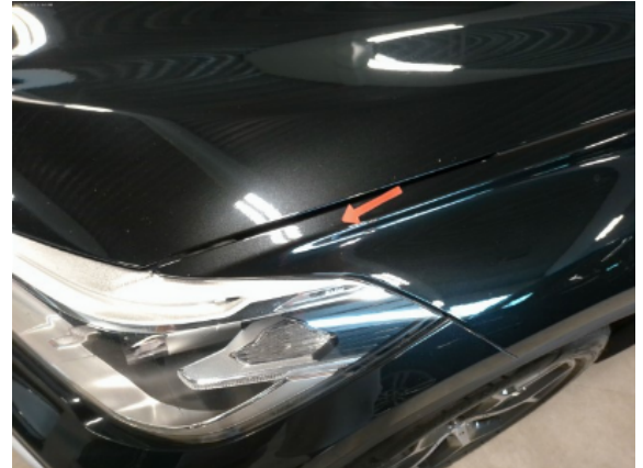
Abbildung 4: Siehe Pos.3