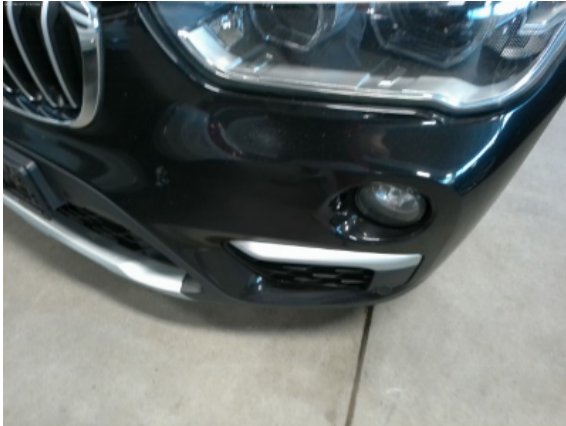
Abbildung 3: Siehe Pos.2