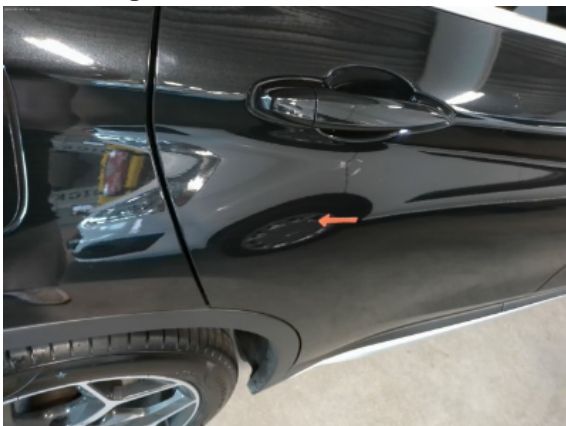
Abbildung 7: Siehe Pos.6