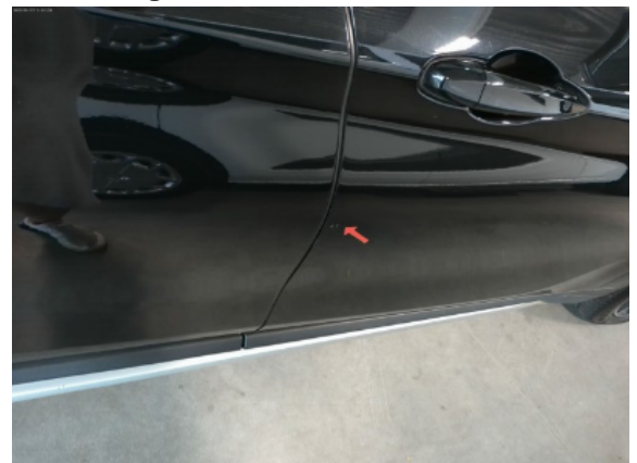
Abbildung 8: Siehe Pos.7