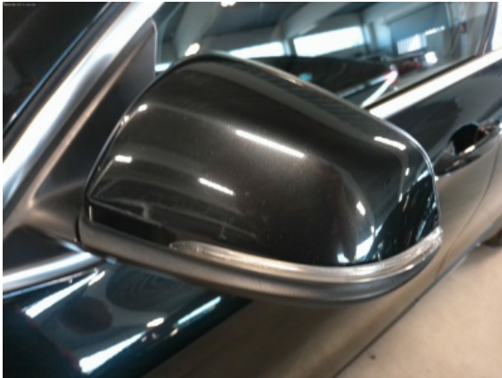
Abbildung 5: Siehe Pos.4