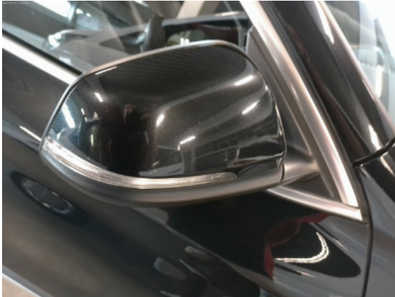
Abbildung 9: Siehe Pos.8