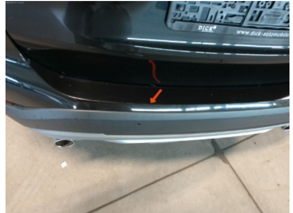
Abbildung 6: Siehe Pos.5