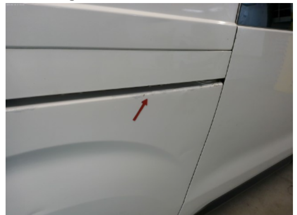
Abbildung 16: Siehe Pos.16