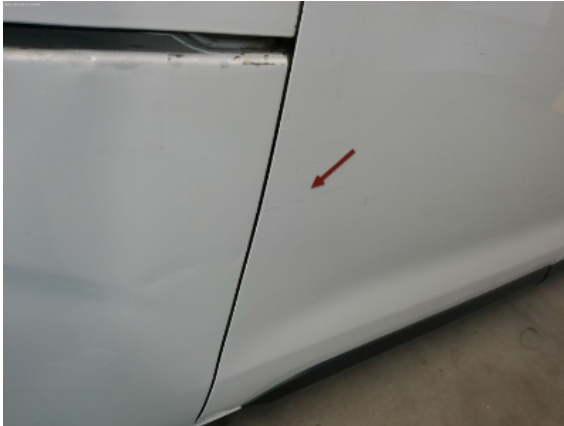
Abbildung 17: Siehe Pos.17