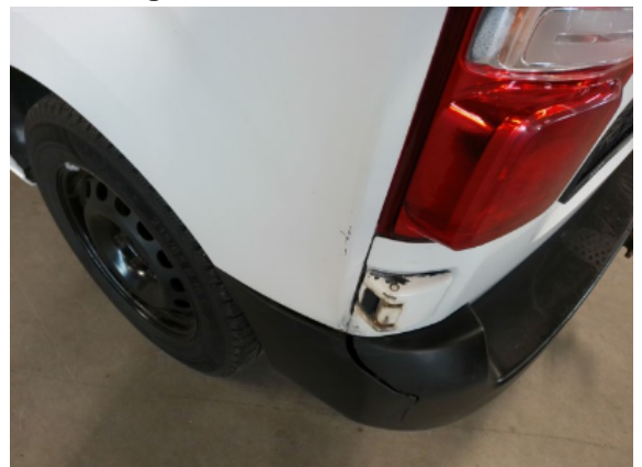
Abbildung 10: Siehe Pos.10