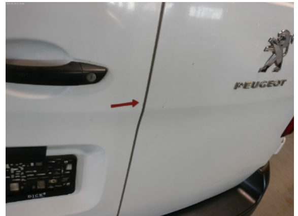
Abbildung 14: Siehe Pos.14