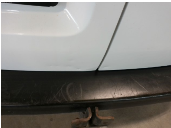
Abbildung 15: Siehe Pos.15