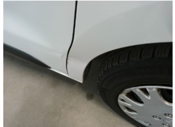
Abbildung 20: Siehe Pos.20