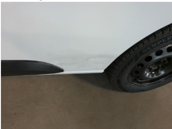
Abbildung 9: Siehe Pos.9