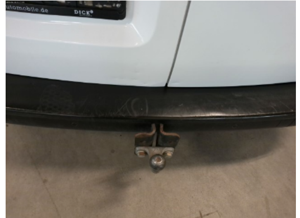
Abbildung 12: Siehe Pos.12