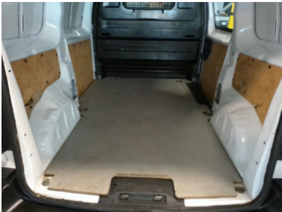
Abbildung 13: Siehe Pos.13