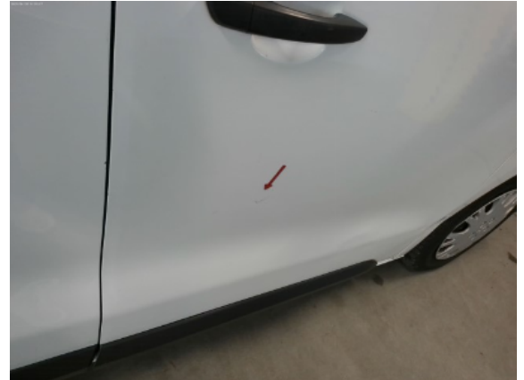
Abbildung 18: Siehe Pos.18