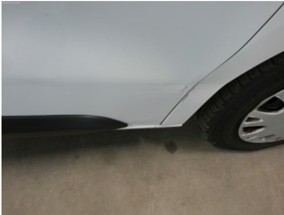
Abbildung 19: Siehe Pos.19