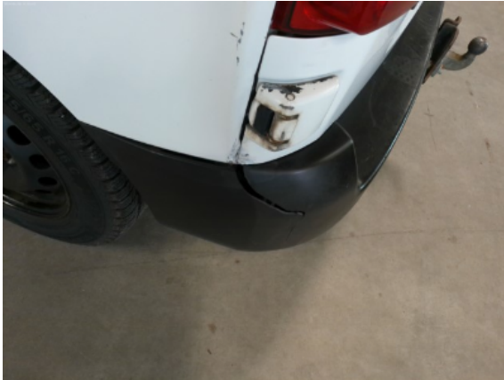
Abbildung 11: Siehe Pos.11