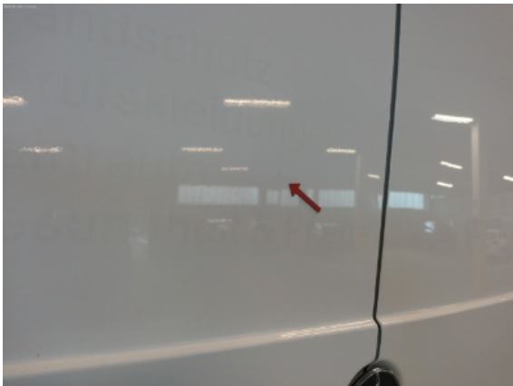
Abbildung 9: Siehe Pos.8