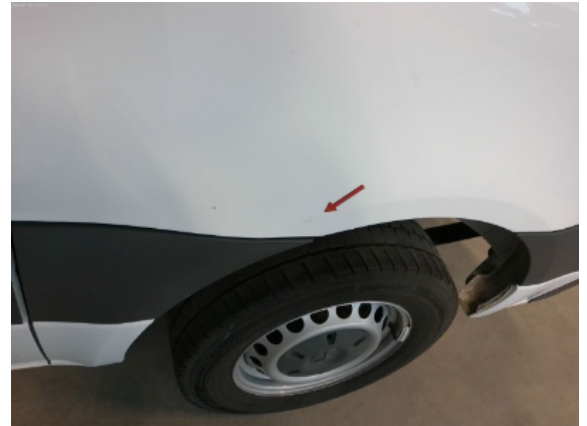
Abbildung 8: Siehe Pos.7