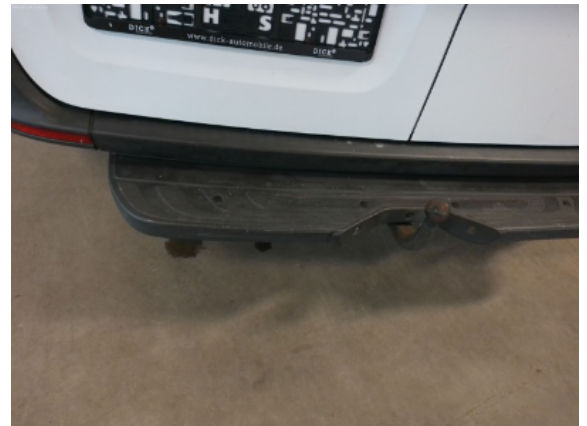
Abbildung 10: Siehe Pos.9