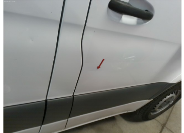
Abbildung 12: Siehe Pos.11