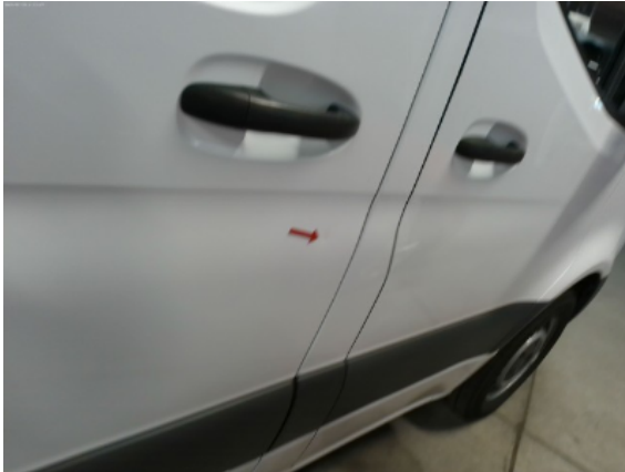
Abbildung 11: Siehe Pos.10