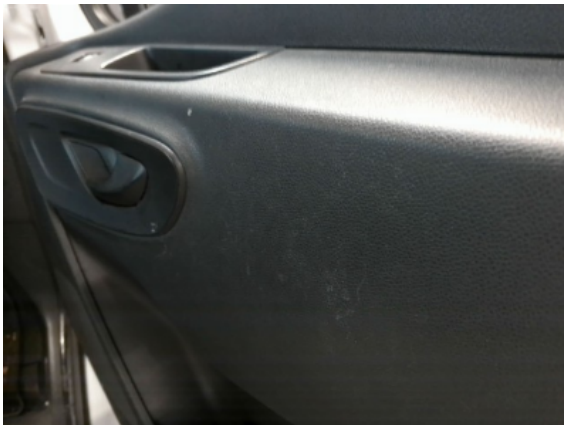
Abbildung 13: Siehe Pos.12