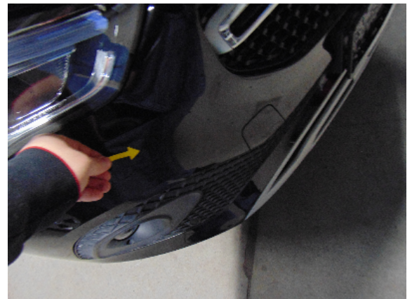
Abbildung 2: siehe pos.2