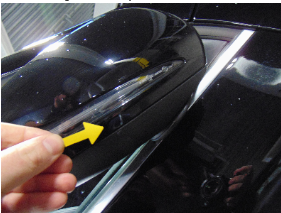
Abbildung 3: siehe pos.3