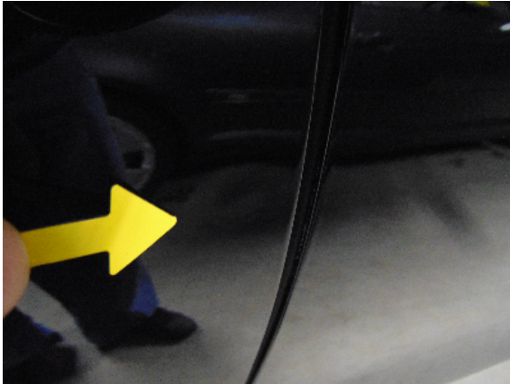
Abbildung 5: siehe pos.5