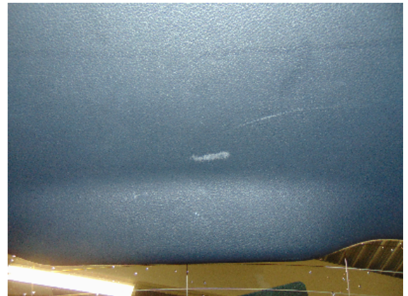
Abbildung 8: siehe pos.8