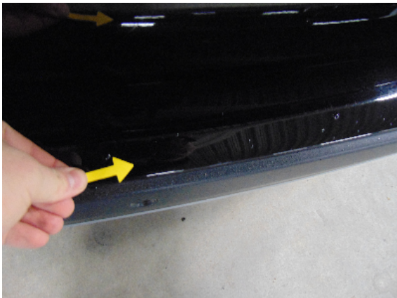
Abbildung 7: siehe pos.7