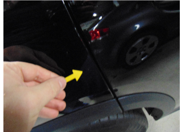
Abbildung 6: siehe pos.6