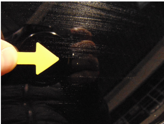
Abbildung 1: siehe pos.1