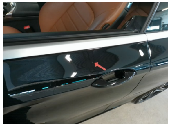
Abbildung 8: Siehe Pos.7