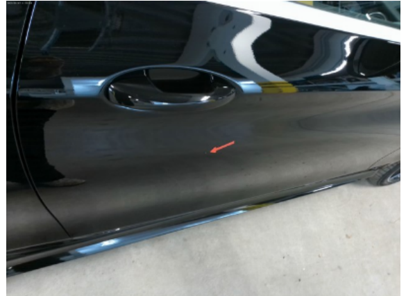
Abbildung 10: Siehe Pos.9