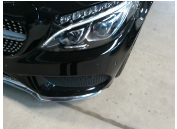
Abbildung 6: Siehe Pos.5