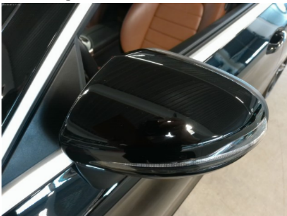
Abbildung 7: Siehe Pos.6