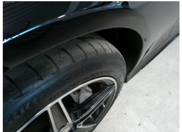
Abbildung 12: Siehe Pos.11