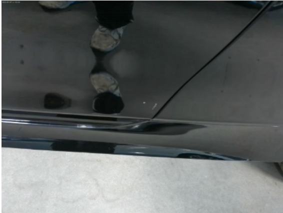
Abbildung 9: Siehe Pos.8