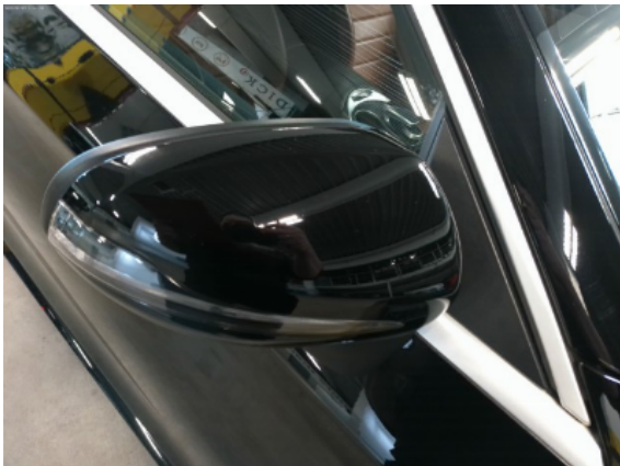
Abbildung 11: Siehe Pos.10