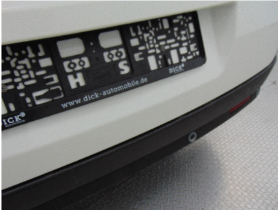
Abbildung 3: siehe pos.3