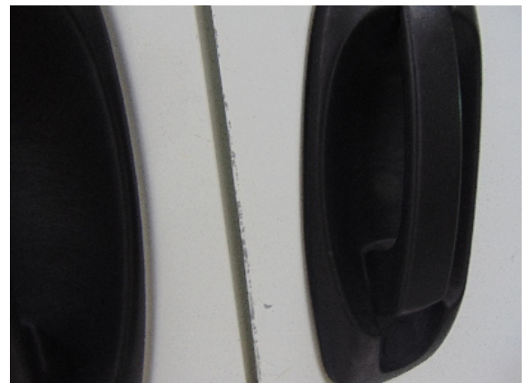
Abbildung 2: siehe pos.2