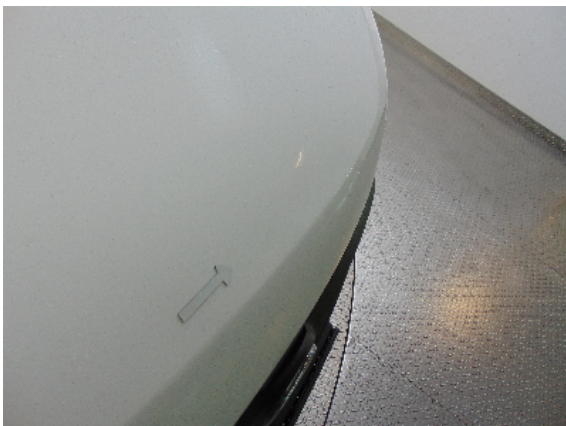
Abbildung 1: siehe pos.1