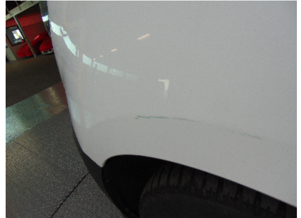
Abbildung 4: siehe pos.4