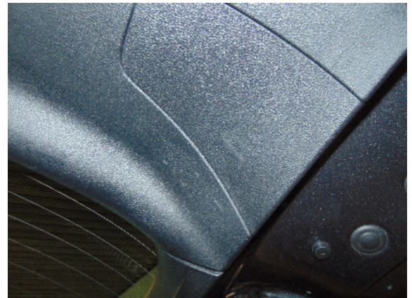
Abbildung 6: siehe pos.6