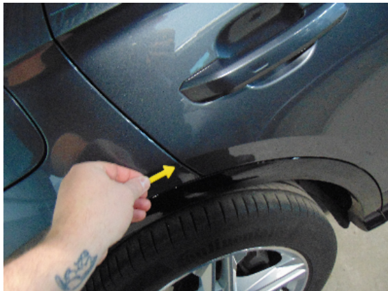
Abbildung 5: siehe pos.5