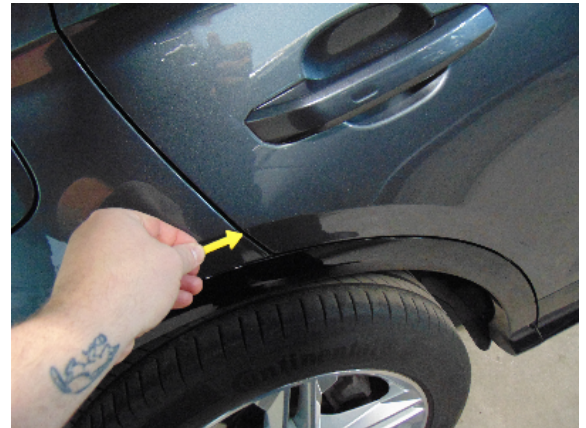
Abbildung 4: siehe pos.4