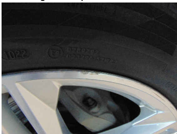
Abbildung 7: siehe pos.7