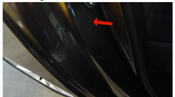
Abbildung 8: Siehe Pos.7