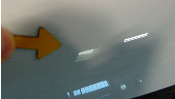
Abbildung 1: siehe pos.1