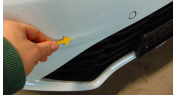
Abbildung 2: siehe pos.2