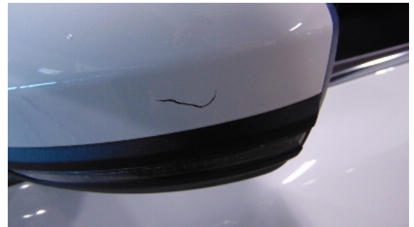
Abbildung 4: siehe pos.4