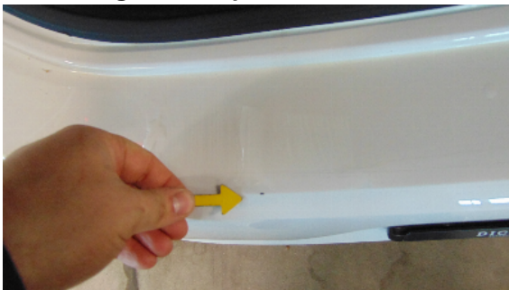
Abbildung 5: siehe pos.5