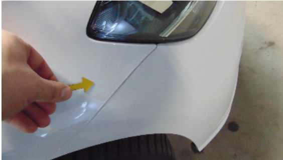
Abbildung 3: siehe pos.3