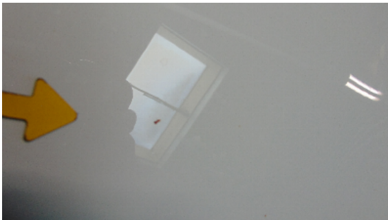
Abbildung 1: siehe pos.1