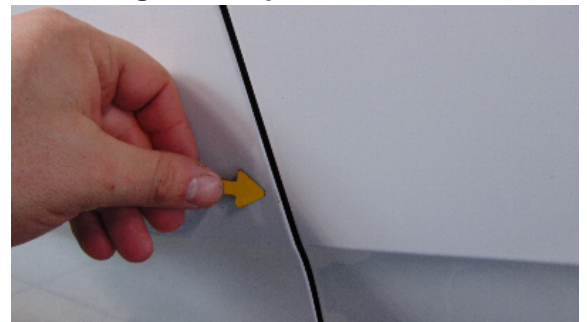
Abbildung 6: siehe pos.6