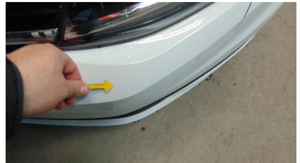
Abbildung 2: siehe pos.2