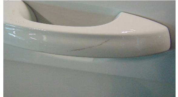
Abbildung 4: siehe pos.4