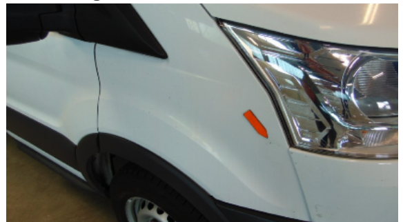
Abbildung 8: Siehe Pos.7