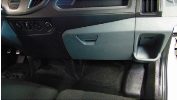
Abbildung 5: Siehe Pos.4