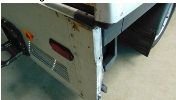
Abbildung 11: Siehe Pos.10