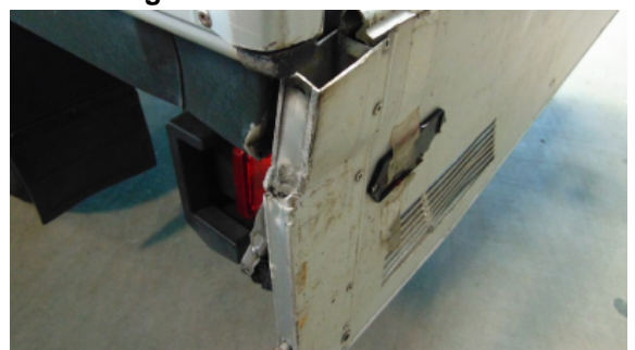
Abbildung 12: Siehe Pos.10