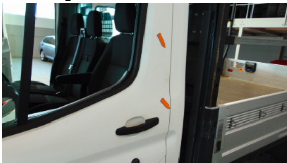
Abbildung 3: Siehe Pos.2