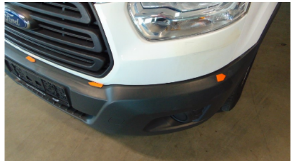
Abbildung 2: Siehe Pos.1