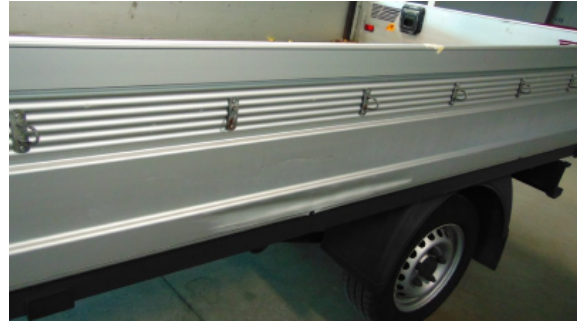
Abbildung 6: Siehe Pos.5