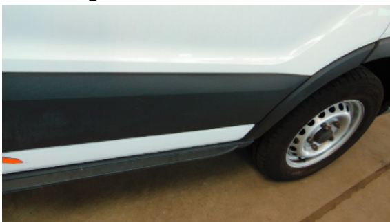
Abbildung 9: Siehe Pos.8