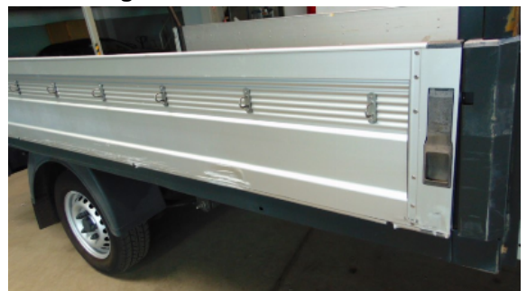
Abbildung 10: Siehe Pos.9