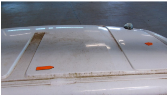
Abbildung 7: Siehe Pos.6