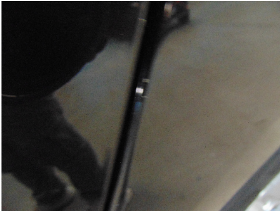
Abbildung 5: siehe pos.4