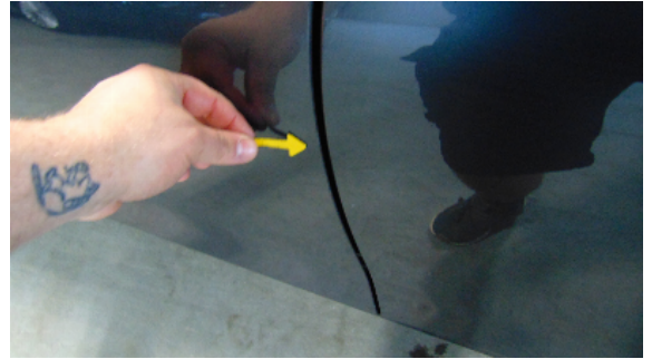
Abbildung 6: siehe pos.6