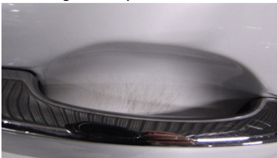
Abbildung 3: siehe pos.3