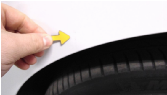
Abbildung 1: siehe pos.1