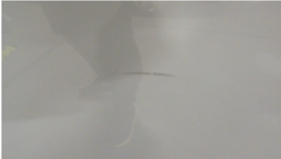
Abbildung 5: siehe pos.5