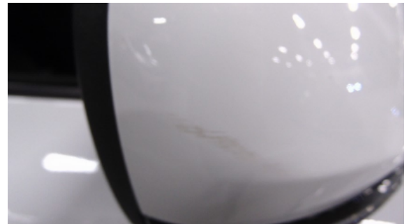
Abbildung 2: siehe pos.2