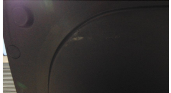
Abbildung 6: siehe pos.6