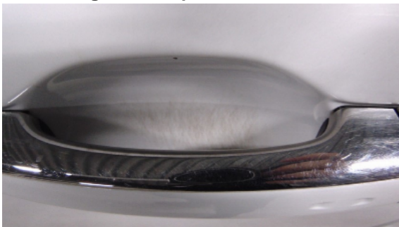
Abbildung 7: siehe pos.7