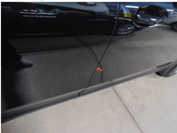
Abbildung 7: Siehe Pos.6