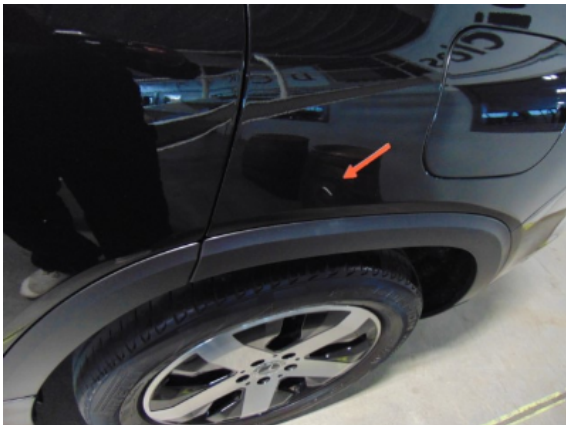
Abbildung 5: Siehe Pos.4