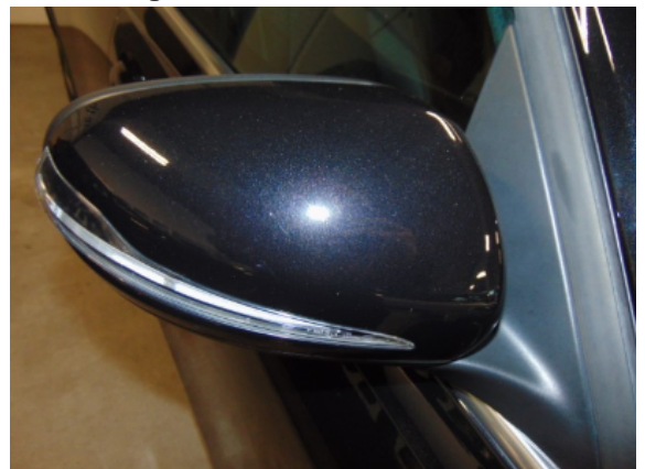
Abbildung 8: Siehe Pos.7