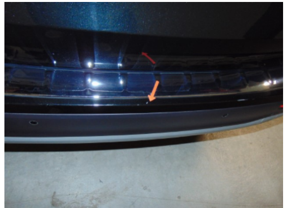
Abbildung 6: Siehe Pos.5