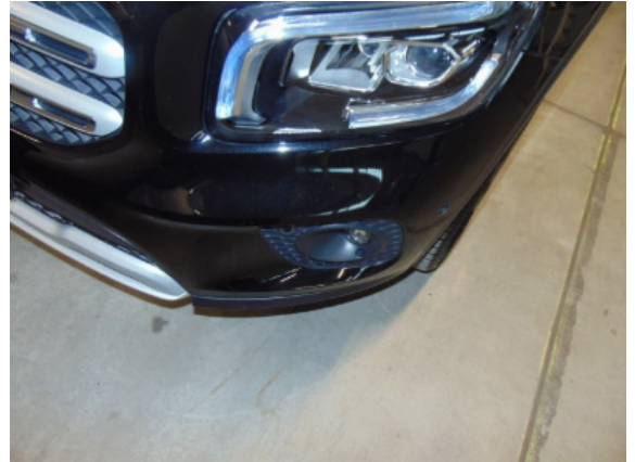
Abbildung 4: Siehe Pos.3