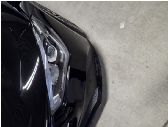
Abbildung 3: Siehe Pos.2