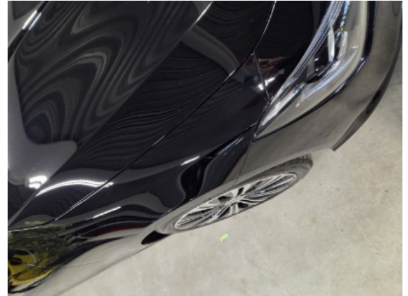
Abbildung 8: Siehe Pos.7