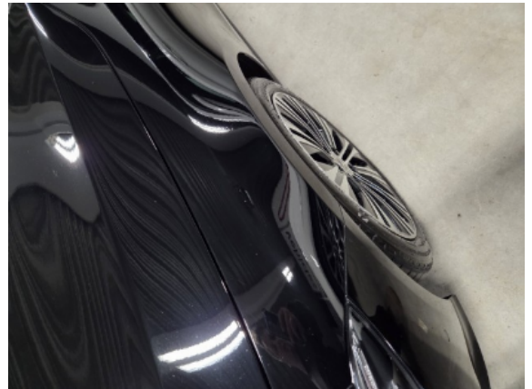
Abbildung 4: Siehe Pos.3