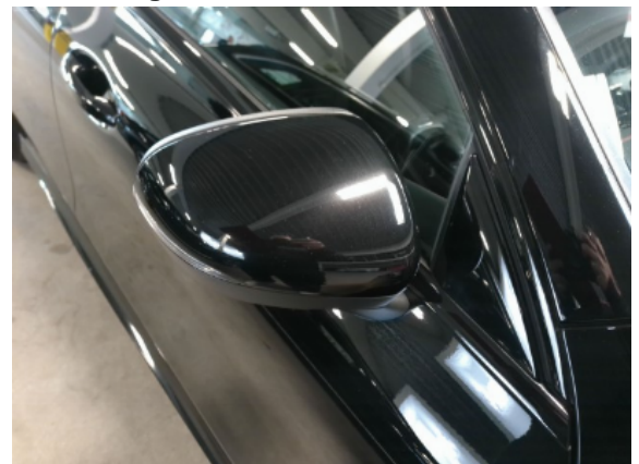
Abbildung 8: Siehe Pos.7