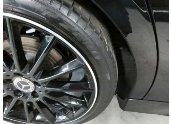
Abbildung 10: Siehe Pos.9