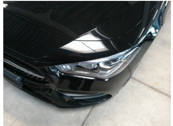
Abbildung 4: Siehe Pos.3