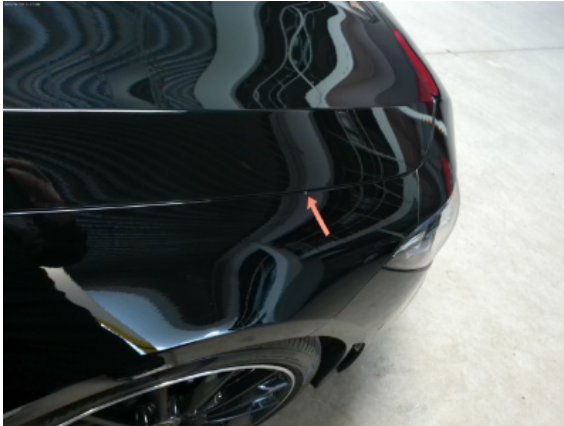
Abbildung 9: Siehe Pos.8