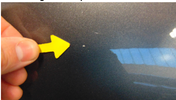
Abbildung 5: siehe pos.5