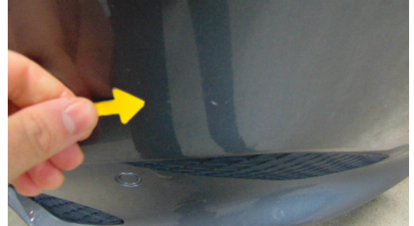
Abbildung 2: siehe pos.2