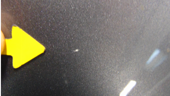
Abbildung 1: siehe pos.1