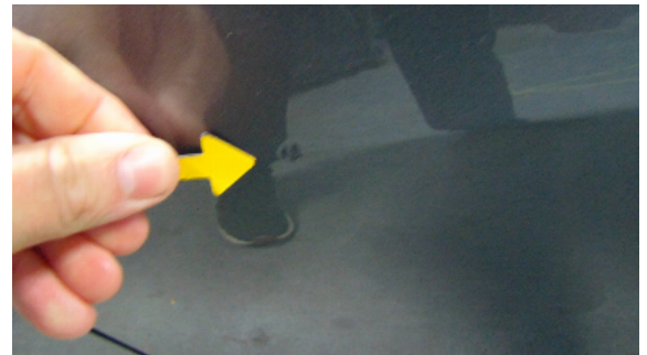
Abbildung 4: siehe pos.4