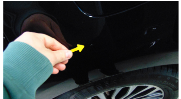
Abbildung 6: siehe pos.6