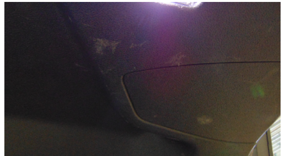
Abbildung 10: siehe pos.10