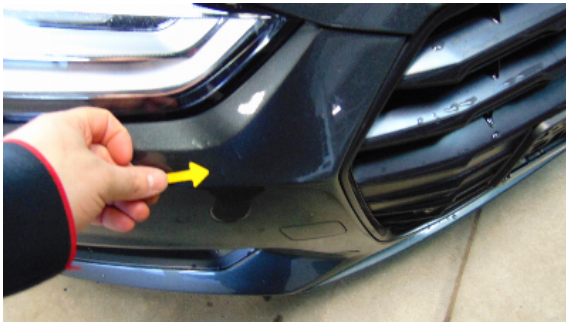
Abbildung 7: siehe pos.7