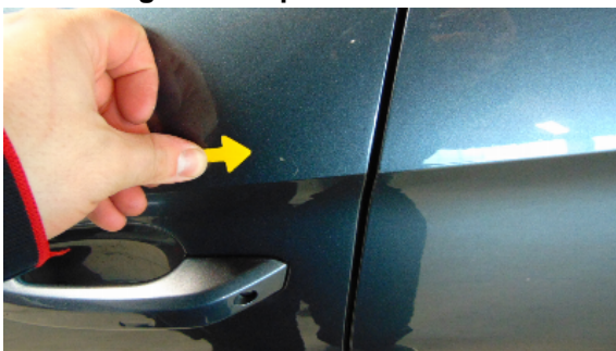
Abbildung 11: siehe pos.11