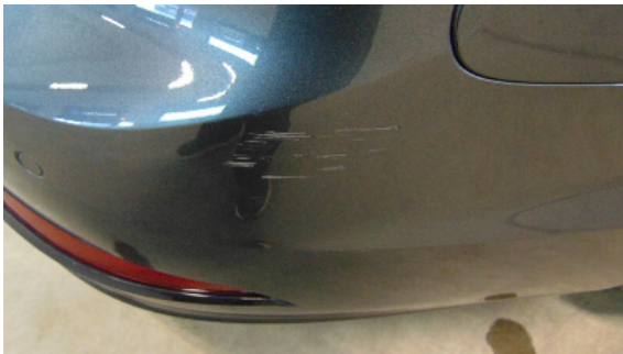
Abbildung 9: siehe pos.9