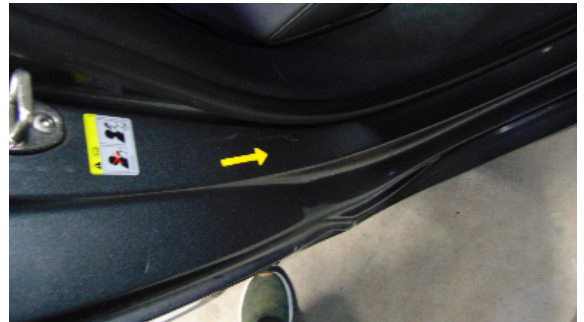
Abbildung 8: siehe pos.8