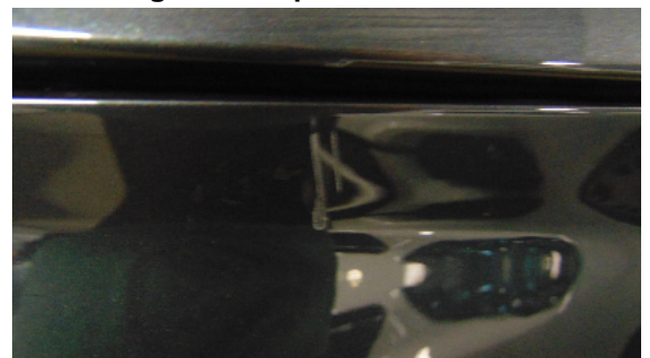
Abbildung 8: siehe pos.8