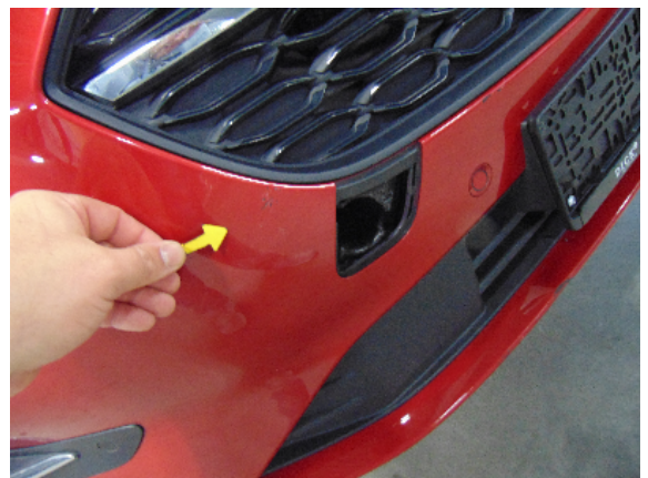
Abbildung 2: siehe pos.2