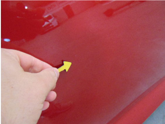
Abbildung 3: siehe pos.3