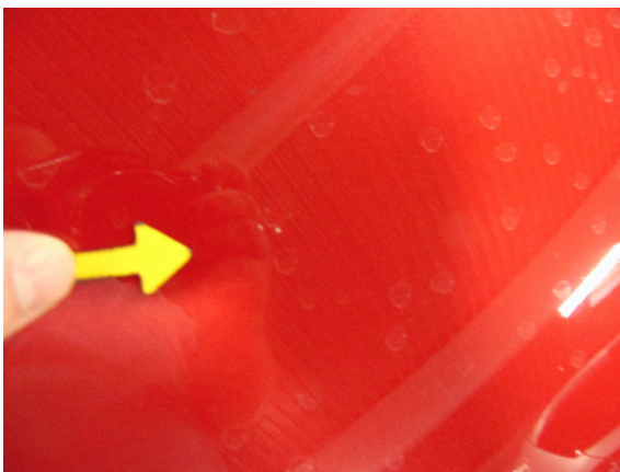
Abbildung 1: siehe pos.1