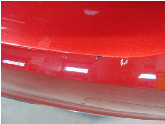
Abbildung 5: siehe pos.5