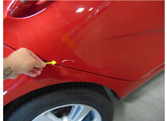
Abbildung 4: siehe pos.4