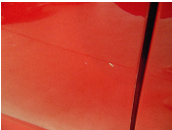
Abbildung 7: siehe pos.7