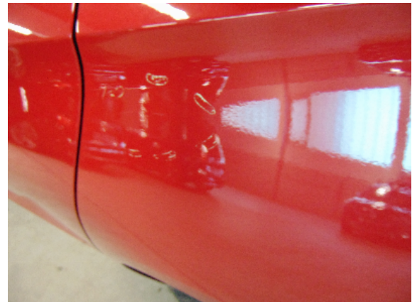
Abbildung 6: siehe pos.6