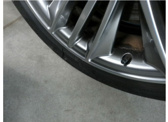
Abbildung 10: Siehe Pos.10