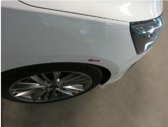
Abbildung 9: Siehe Pos.9