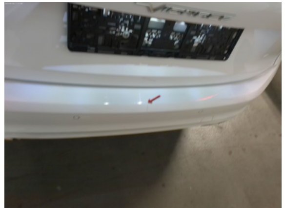
Abbildung 8: Siehe Pos.8